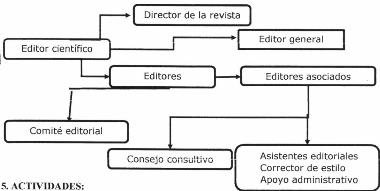
Figura 1. Organigrama de la Revista Médica Hospital Hipólito Unanue de Tacna

La Revista médica Hospital Hipólito Unanue de Tacna está constituida por el Director de la revista, editor principal, comité científico, comité editor, editores asociados, comité de publicaciones, corrector de estilo, coordinador de la revista.